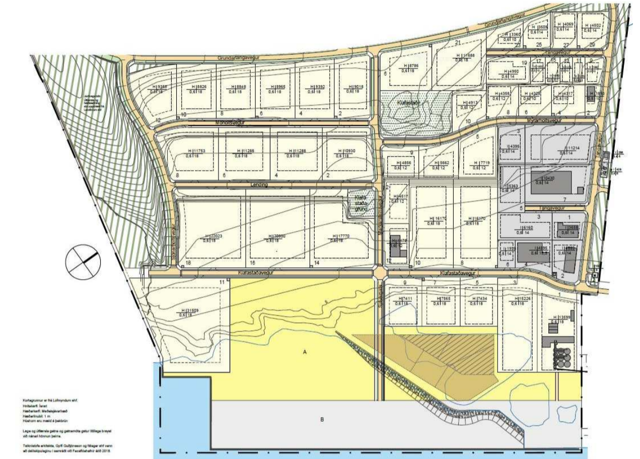
FYRIR BREYTINGU Deiliskipulag athafnasvæðis, athafna- og hafnarsvæðis og iðnaðarsvæðis á Grundartanga, vestursvæði. Breyting maí 2018 (Ekki í kvarða).