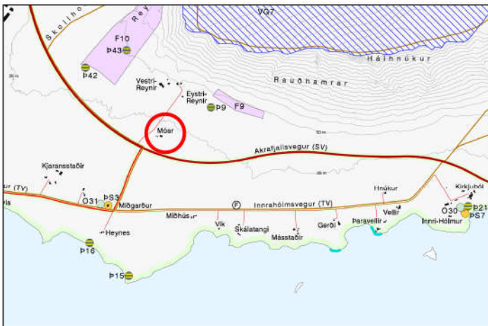
Gildandi sveitarfélagsuppdráttur mkv. 1:50.000