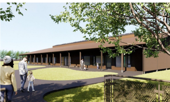
Skýjaborg - Nýr leikskóli í Melahverfi.