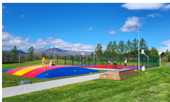
Vinavöllur í Melahverfi.