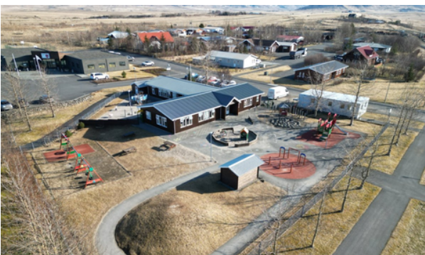
Færanlega kennslustofan, Sólin.