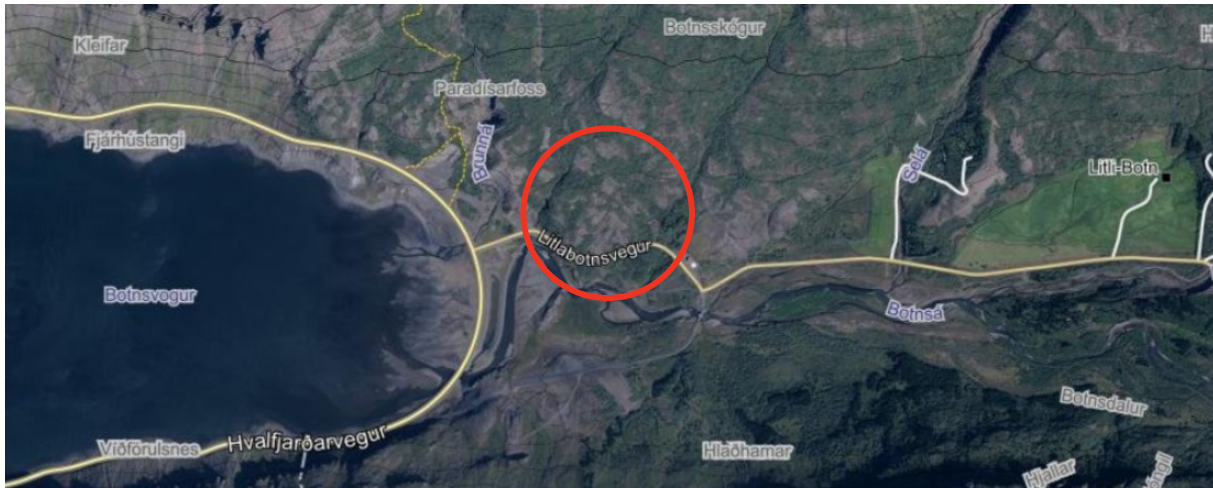
MYND 2. Skipulagssvæðið er innan rauða hringsins.

Aðkoma að svæðinu er af Hvalfjarðarveg um Litlabotnsvegi (5001). Allmikið vatn kemur undan Selfjalli, skammt ofan skipulagssvæðis, m.a. með Brunná, Paradísarfoss og Míganda. Þá er fossinn Glymur skammt frá skipulagssvæðinu.