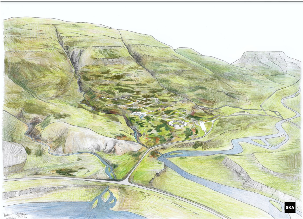
Mynd 2 Yfirlitsmynd til skýringar. Mynd unninn af Architecturstudio SKA.

Starfsemin leggur áherslu á vistvæna orku og sjálfbærni. Gert er ráð fyrir um 100 m 2 gróðurhús á svæðinu og skoðað verður sá möguleiki á að koma fyrir lítilli vatnsvirkjun (mest 150 kW) í nærumhverfi svæðisins í samráði við aðliggjandi landeigendur. Einnig er gert ráð fyrir að dreifing raforku á svæðinu verði bætt meðal annars með lagningu þriggja fasa rafmagns inn í Hvalfjarðarbotn sem einnig mun nýtast annarri byggð á svæðinu.